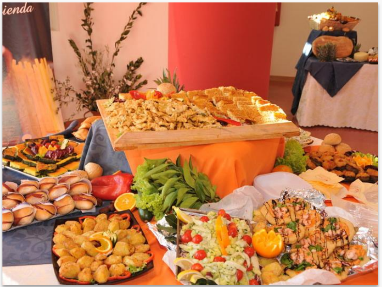
Momenti di convivialità